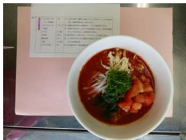
⑦トマトの味噌冷麺（濱田）