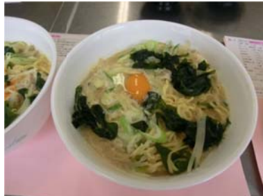
②豆乳味噌味鍋焼きラーメン（大西）