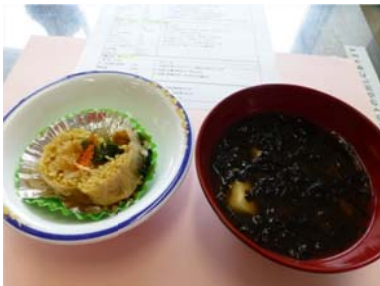
④生春巻き 2 種+スープ