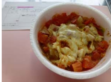
⑤トマトとチーズの味噌ラーメン（松林）