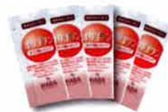
サンプル品 1包あたり 7g ×20包