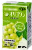
マスクット 65kcal ビタミンE 8mg