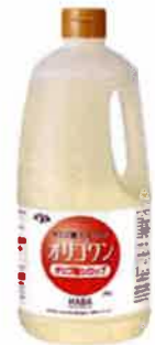
◆オリゴワン オリゴ糖シロップ 2kg