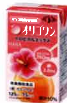
トロピカル ミックス 75kcal 鉄 3.8mg カルシウム 260mg