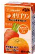
オレンジ& キャロット 58kcal 食物繊維 2g